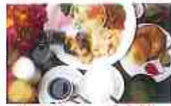
朝食バイキング(有料)